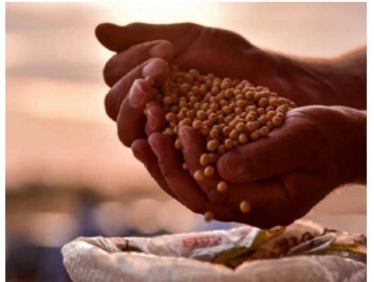
A diminuição de um ponto percentual na umidade deixa a massa de soja 1,15% mais leve e o produtor teria prejuízos na comercialização

Segundo ele, o setor precisa de um prazo de seis meses para discutir o tema com a cadeia antes da publicação do Regulamento Técnico da Soja. “Não acredito que o Mapa oficializará o texto antes de permitir as devidas discussões”.