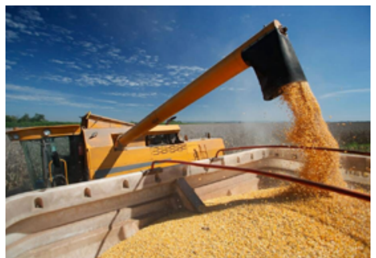
Brasil começou novembro embarcando 2.390.892 toneladas de milho não moído para exportação

Já o preço por tonelada obtido caiu 20,6% no período, saindo dos US$ 284,70 no ano passado para US$ 226,00 no mês.