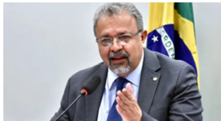
Elias Vaz: erro ao receber do Ministério mulher de narcotraficante do Amazonas

Vaz ainda afirmou ter sido repreendido por Dino. "Ele