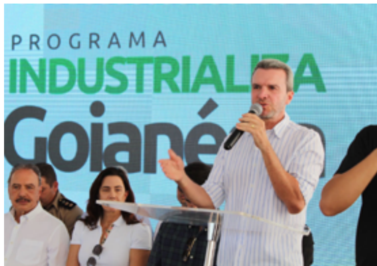
Carlos Veículos: geração de empregos e renda