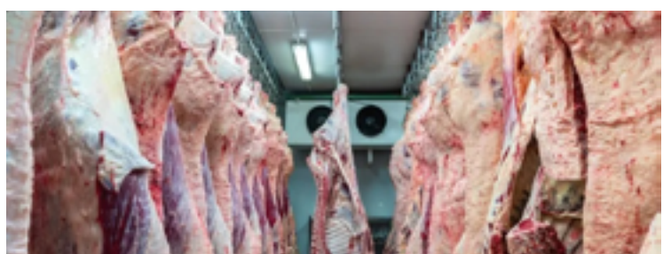
Média diária exportada de carne bovina fresca, refrigerada ou congelada ficou em 10,4 mil toneladas na segunda semana de novembro/23

O valor negociado para o produto em novembro/23 ficou em US $ 336.654 milhões, tendo em vista que o preço comercializado durante o mês de novembro do ano anterior foi de US$ 777,889 milhões. A média diária ficou em US $ 48.093 milhões e registrou um avanço de 23,7%, frente ao observado no mês de novembro do ano passado, que ficou em US$ 38.894 milhões.