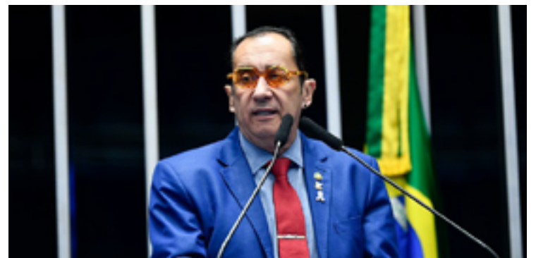
Jorge Kajuru: cuidados preventivos com Inteligência Artificial