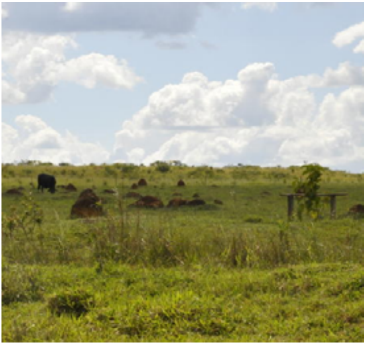
A pretensão do governo é regenerar até 40 milhões de hectares de pastagens entre 10 e 15 anos

O programa de recuperação e conversão de pastagens degradadas, criado pela Embrapa Cerrados de Goiás, será lançado, para todo o Brasil, pelo presidente Luiz Inácio Lula da Silva, no dia 22 de novembro