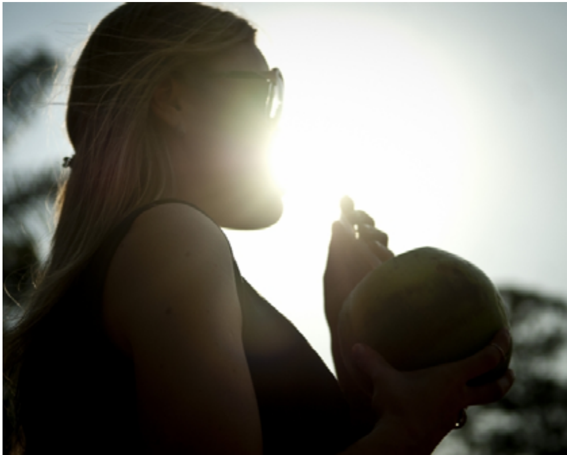
Previsão anterior de altas temperaturas era até quarta-feira, 15

O alerta de grande perigo, que foi ampliado, segue para Goiás, Distrito Federal e mais 13 estados devido a ocorrência de baixa umidade relativa do ar. Antes, o alerta abrangia sete unidades federativas