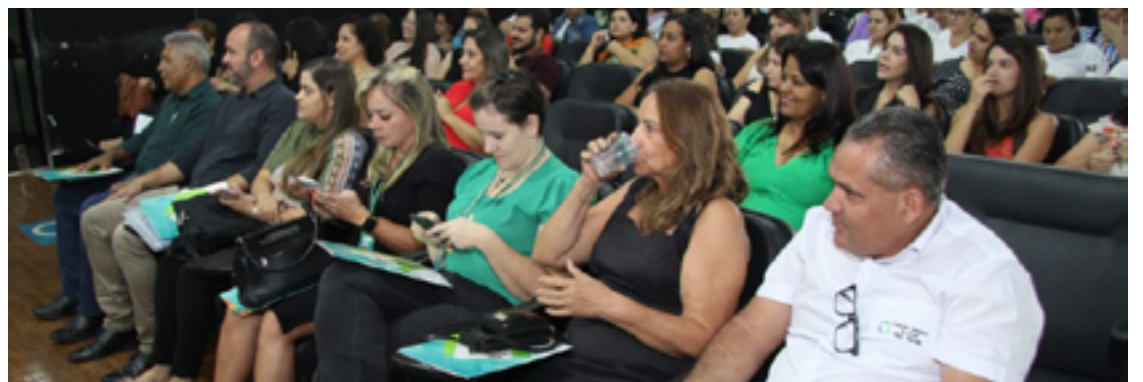
Público presente na cerimônia de encerramento do curso intensivo em Preceptoría no SUS — Foto: Reprodução.