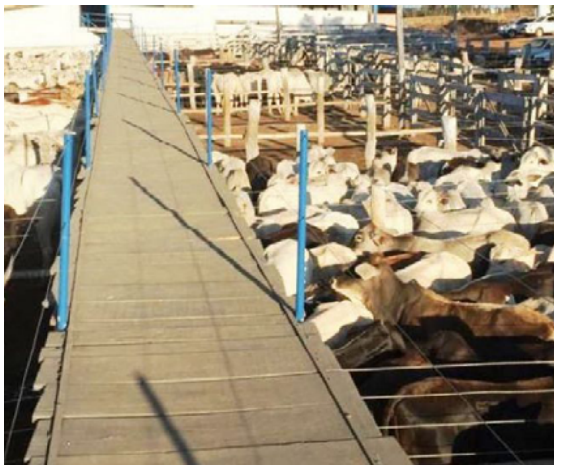
Empresários do setor de eventos agropecuários devem se recadastrar para eventos do calendário 2024 na Agrodefesa GO — Foto: Reprodução.

Após o recadastramento, um agente da Agrodefesa agenda uma vistoria no local para emitir o parecer sobre a sua regularidade perante as normas e legislações pertinentes a cada tipo de evento. É uma avaliação para verificar o cumprimento dos requisitos sanitários vigentes para aquele evento.