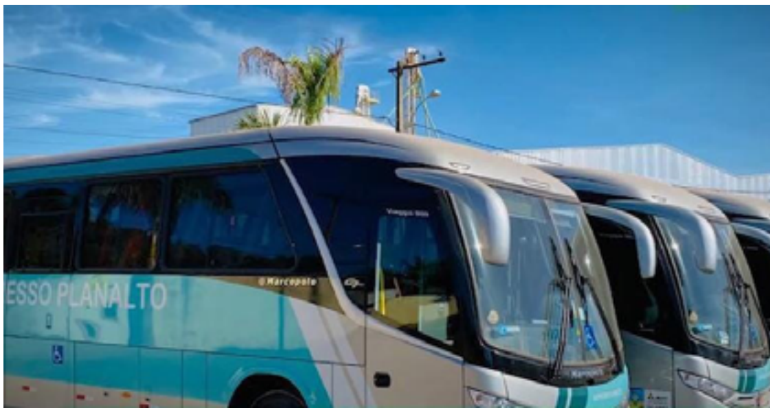
Novo sistema de transporte coletivo urbano em Rio Verde vai aperfeiçoar o serviço para atender os usuários com agilidade e comodidade, diz prefeitura

Novos ônibus são equipados com ar-condicionado, câmeras de segurança e reconhecimento facial, além de outras inovações