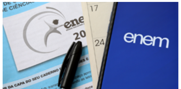
Prova de ciências da natureza do ENEM, aplicada neste domingo (12), voltou a abordar as questões negativas relacionadas ao agronegócio — Foto: Reprodução.

Na quarta-feira 8, a Comissão de Agricultura e Pecuária da Câmara aprovou um requerimento para convidar o ministro da Educação, Camilo Santana (PT), a prestar esclarecimentos sobre questões da primeira prova.